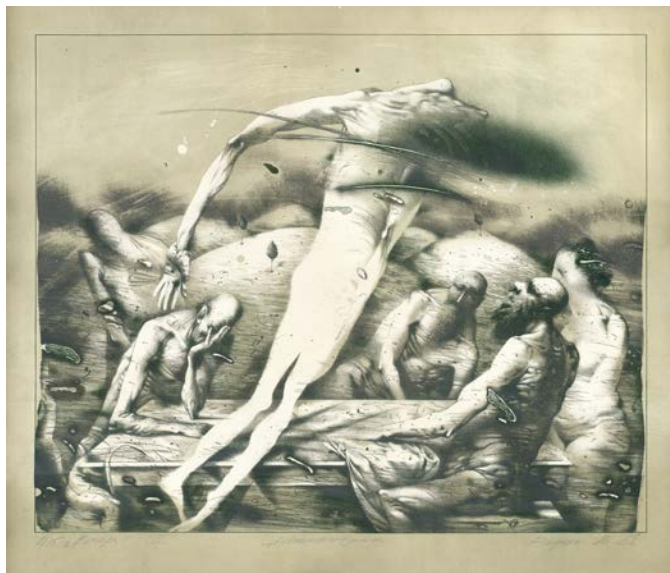
Рис. 2. В.А.Радько "Вечір" кольорова літографія 47 х 65см, 1988р.

Художник повертається до техніки літографії працюючи над серіями, що їх було створено під час роботи у творчих групах Будинку творчості «Сенеж» Спілки художників СРСР, розташований у Підмоскві. Починаючи з 1972 року СХ СРСР організовує у м. Солнечногорск на березі озера Сенеж молодіжні групи, в яких отримали путівку в життя декілька поколінь радянських художників [4]. Під час своєї першої поїздки «на Сенеж» Володимир створює серію «Замок Ричарда», до якої входять наступні аркуші: «Ранок», «День», «Вечір», розмір кожного з них 49х55см, і виконаних у техніці кольорової літографії надрукованої з двох каменів, та «Рисунок голови дівчини» 33х38см, кольорова літографія, друк з одного каменю (1984). Під час свого другого перебування у творчій групі автор працює над аркушем «Гра» 56х48см, літографія, друк з одного каменю (1987). А перебуваючи на творчій базі під Москвою у третє, створює серію, яку сміливо можна назвати візитівкою графіка. Мова йде про три аркуші, об'єднаних назвою «Вечір» і виконаних у техніці кольорової літографії надрукованої з трьох каменів (1988) аркуш з якої представлений на рис.2.